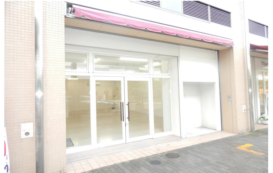
物件名 TOWER111 105号室